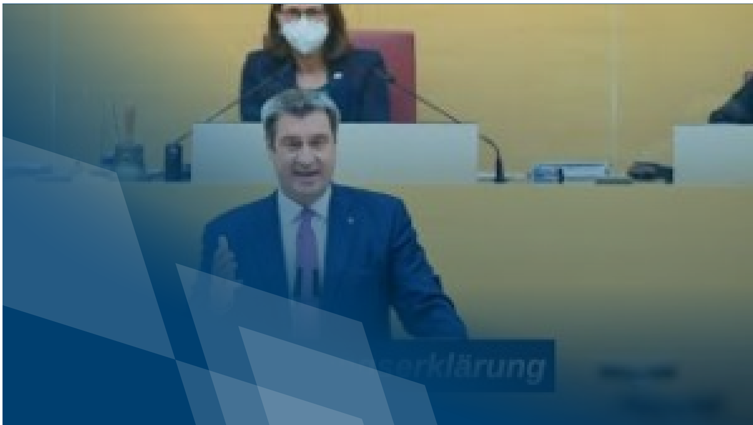
Regierungserklärung von Ministerpräsident Dr. Markus Söder zu Ukraine-Krieg und Corona-Pandemie