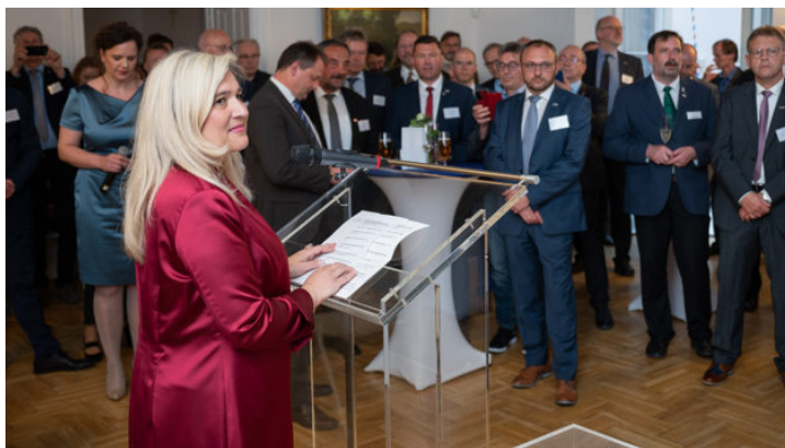
Den česko-bavorského komunálního partnerství v Praze s ...