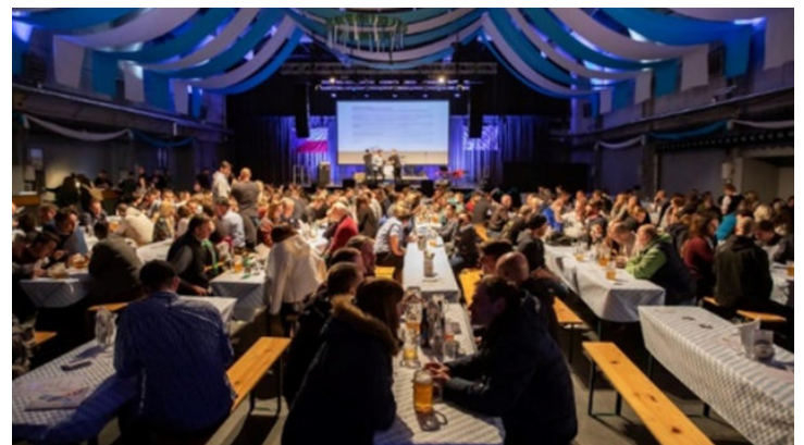
Česko-bavorský festival „Treffpunkt: kontakt“ – ...