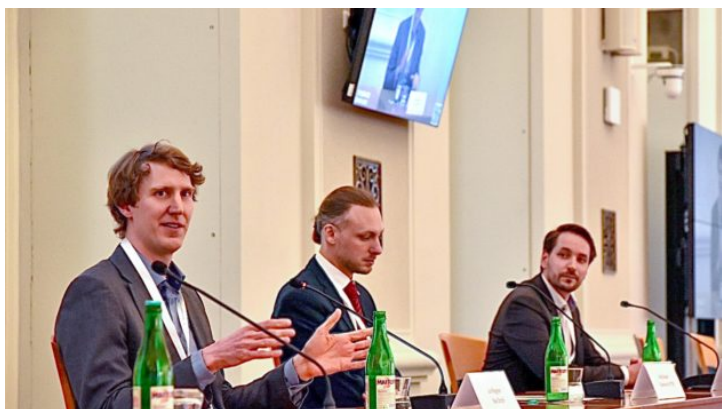
Česko-německý vodíkový den v Praze

Bavorsko sedmkrát jinak: Dobijte si baterie