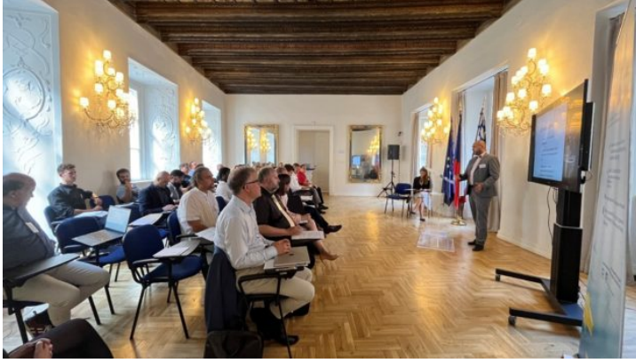
Bavarian-Czech AI and Robotics Workshop