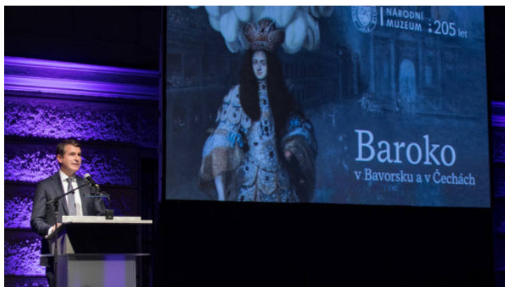
Zahájení česko-bavorské zemské výstavy v Praze