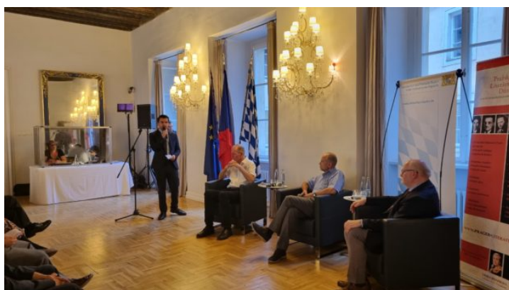
Literatura a dějiny v česko-bavorském dialogu