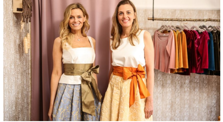
A co ty? Česko a Bavorsko v kulturním dialogu bez hranic