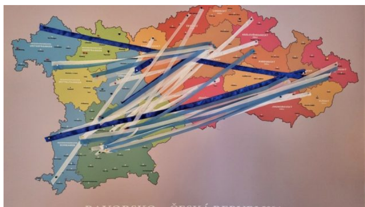
Česko-bavorské setkání učitelů