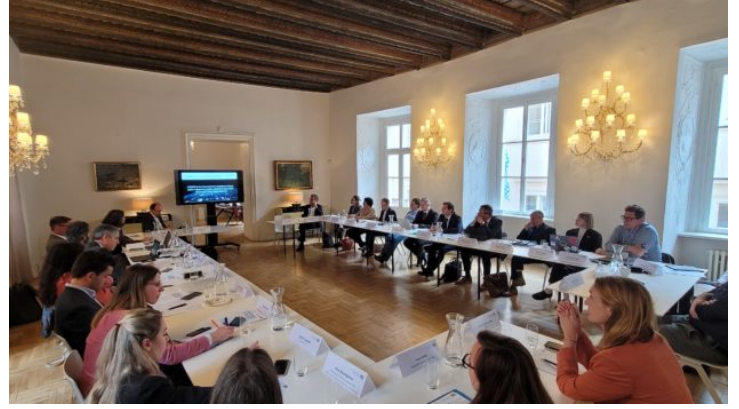
Odborná diskuze s agenturou EUSPA