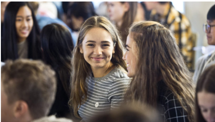
Česko-bavorský stipendijní program