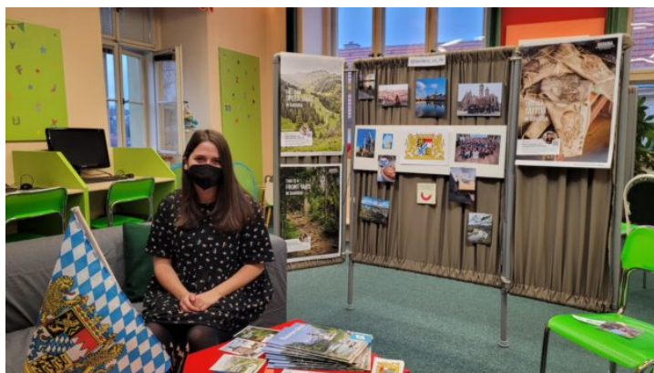
Živá knihovna pro studenty ve Slaném

Bavorsko sedmkrát jinak: Dobijte si baterie