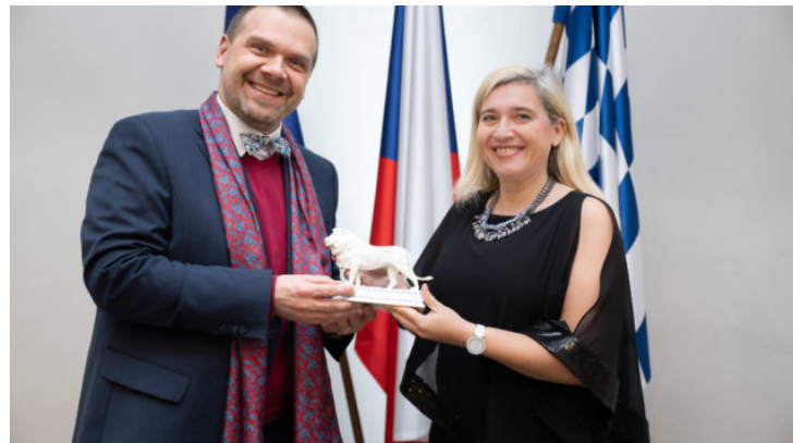
Novoroční recepce 2023