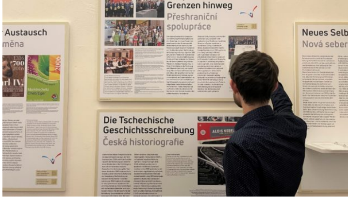
„So geht Verständigung – dorozumění“