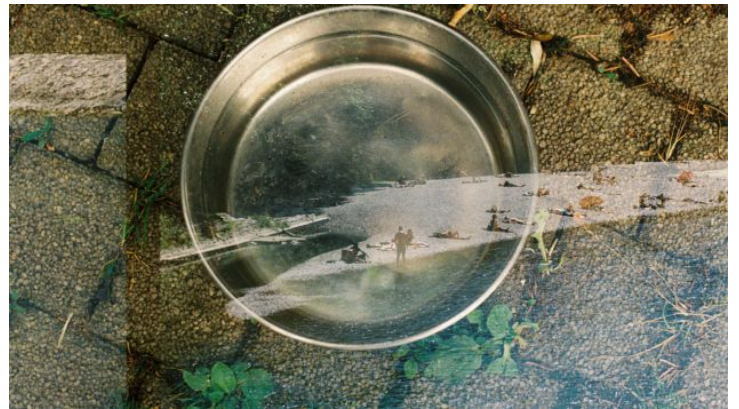
„Na druhý pohled | Auf den zweiten Blick“