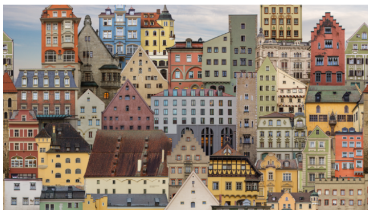
Proměněné fotografie - výstava umělkyně Leny Schabus