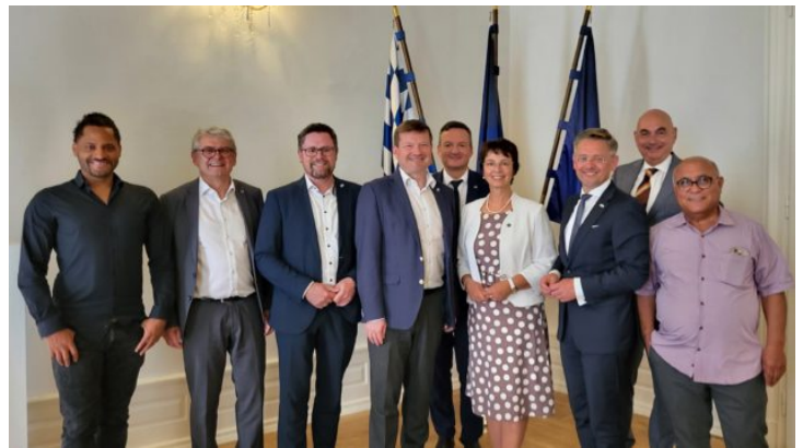
Návštěva Evropského výboru Bavorského zemského sněmu ...