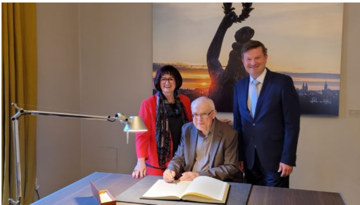
Vernisáž výstavy „Čechy neleží u moře“ na ...

Zastoupení Svobodného státu Bavorsko v České republice prohlubuje vztahy Bavorska s vládou České republiky, s českou občanskou společností a se zástupci hospodářství, a to prostřednictvím společných projektů a akcí, ale i jako „vizitka Bavorska“ v České republice.