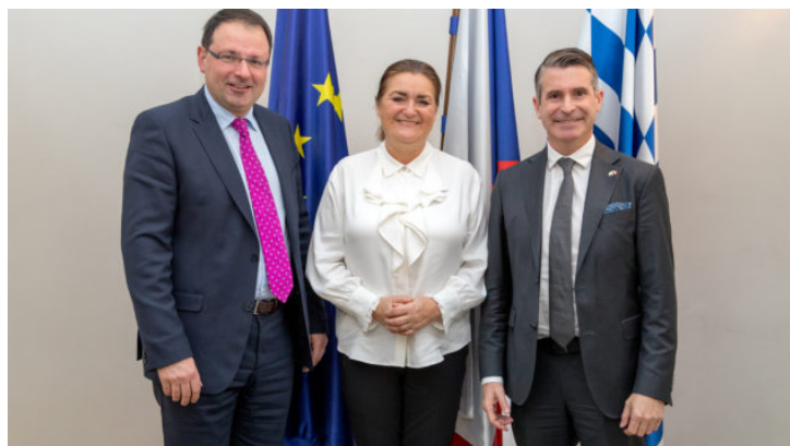
Novoroční recepce 2024