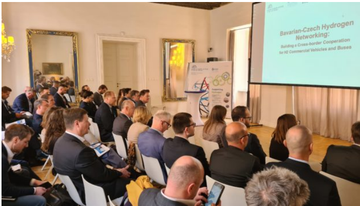
Bavarian-Czech Hydrogen Networking