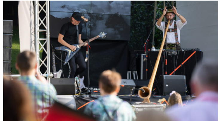
Bavorsko na Dni otevřených dveří německého velvyslanectví ...