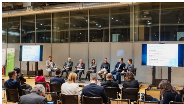
Pracovní setkání na téma „Sustainability and Space“ ...