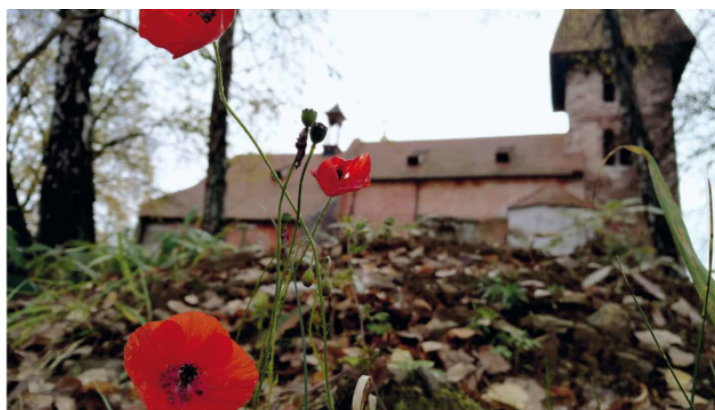
Výstava „Vybledlé, ale ne ztracené“