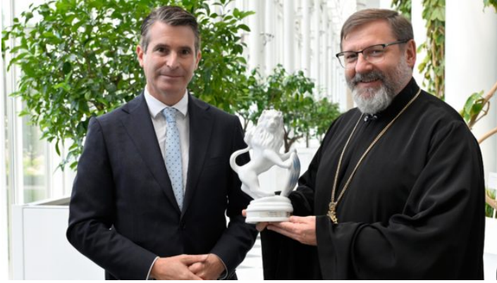
Gespräch mit Seiner Seligkeit Sviatoslav Shevchuk, Großerbischof ...