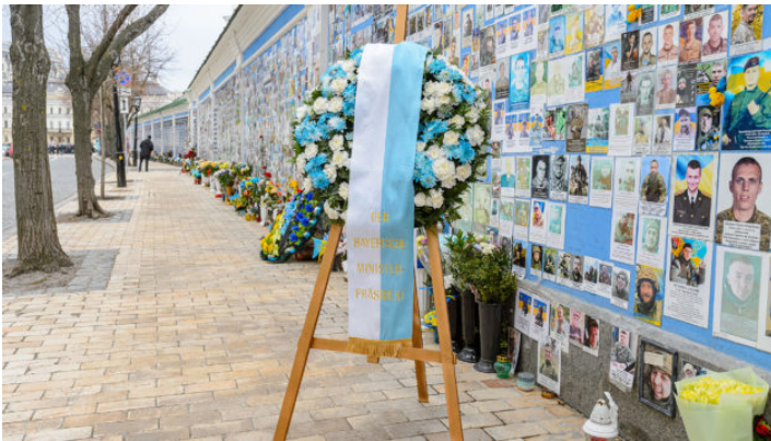
2. Jahrestag des russischen Angriffskrieges in der Ukraine