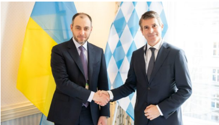
60. Münchner Sicherheitskonferenz