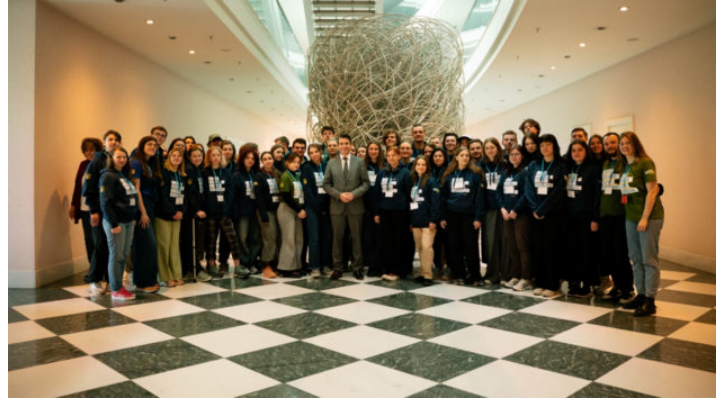
Gespräch mit den Studierenden der Ukraine Leadership Academy ...