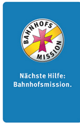
Katholische Bahnhofsmision München maggiori informazioni >