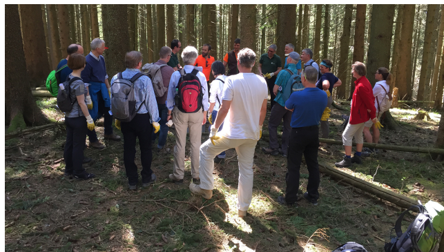
Participants du IX programme TOP Management

Grâce au Programme TOP Management le gouvernement bavarois sensibilise les cadres de haut niveau de l'administration publique avec des séminaires et voyages d'étude pour les développements de la société au niveau économique, politique et social. Les participants élargissent ainsi leurs compétences managériales de façon ciblée.