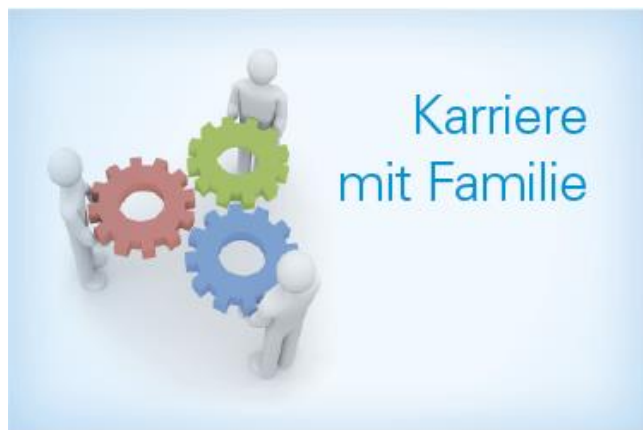
Logo programme de mentoring

Le gouvernement bavarois a établi avec le pacte familial bavarois un signal pour améliorer la compatibilité entre la vie de famille et la vie professionnelle. L'objectif étant d'adapter le monde du travail aux nouveaux modèles de vie et familiaux. Le programme de mentoring permettant d'allier carrière avec famille est une mesure prise pour mettre en place les objectifs du pacte familial en accord avec son temps, concret et effectif dans le milieu professionnel.