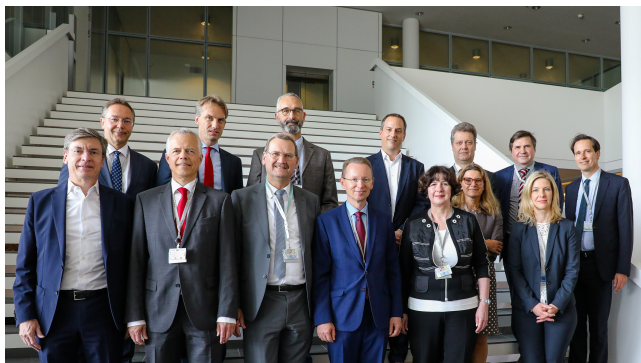
Gruppe der Personalabteilungsleiter bei der Infineon Technologies AG.

Das Begegnungsprogramm Brücken bauen richtet sich an Personalabteilungsleiter der Ressorts. Bei informellen Treffen tauschen sich die Spitzenbeamten mit Personalverantwortlichen nichtstaatlicher Organisationen und führender Unternehmen aus. Zeitgleich bieten diese Treffen auch eine Gelegenheit zu einem