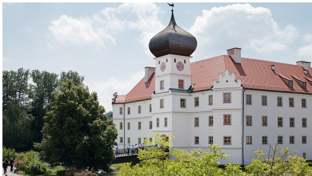
Schloss Hohenkammer.

Das Internationale Seminar wird alle zwei Jahre von der Bayerischen Staatskanzlei in Kooperation mit dem Generalkonsulat der Vereinigten Staaten von Amerika und einem weiteren Gastland organisiert. Es präsentiert renommierte Referentinnen und Referenten und behandelt aktuelle, grenzüberschreitende Themen. Das Ziel ist die Förderung der internationalen Kompetenz der bayerischen Ministerialverwaltung. Die Arbeitssprache ist daher Englisch.