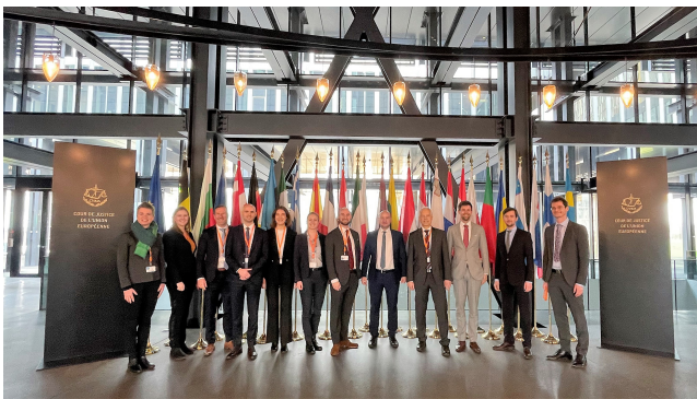
Teilnehmer des VII. Exzellenz Programms Europa.

Das Exzellenz Programm Europa bildet vielseitig und international einsetzbare Europa-Experten aus. Führungskräfte in der öffentlichen Verwaltung erweitern ihre fachspezifischen Kompetenzen und sprachlichen Kenntnisse.