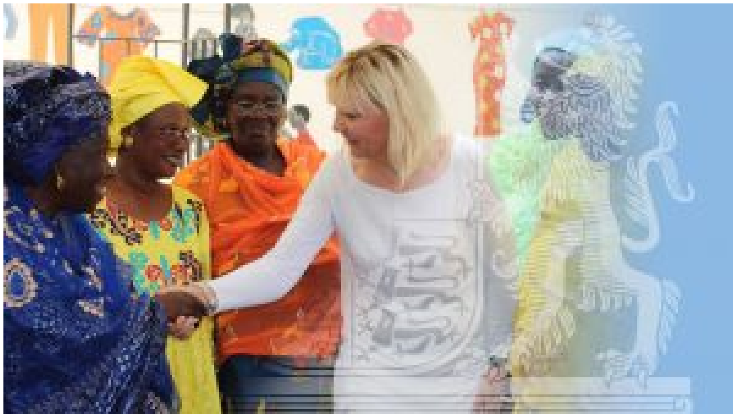
Europaministerin Dr. Beate Merk im Senegal

Die Republik Senegal zählt zu den sicheren Herkunftsländern, aus denen sich Migranten auf den Weg nach Europa machen – in den meisten Fällen ohne Anspruch auf Asyl und eine Bleibeperspektive. Das Land ist neben Tunesien, Nordirak und Libanon Teil des von der Staatsregierung 2016 beschlossenen Sonderprogramms zur Bekämpfung von Fluchtursachen. Insgesamt werden mehr als 20 Millionen Euro in Projekte zur Versorgung von Flüchtlingen und zur Schaffung von Bleibeperspektiven fließen.